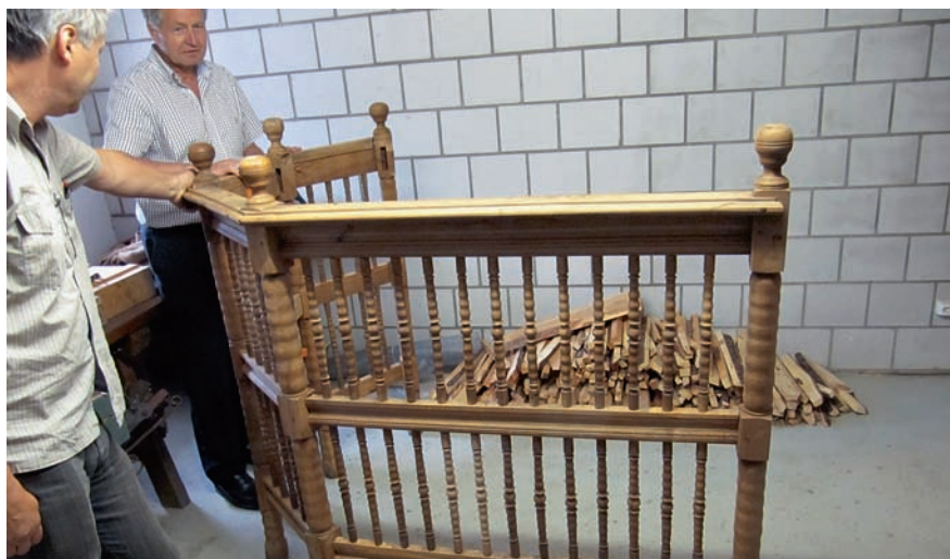
Le vieux cadre de poêle retrouvé dans le grenier

La taille du foyer peut de nos jours être définie exactement selon la quantité déterminée de bois à utiliser. La quantité totale de bois sera brûlée en une seule combustion, ce qui demande peu d'investissement dans l'utilisation. Il faudra en outre concevoir une longueur de tirage des gaz qui garantisse un rendement d'au moins 78%. Plus grand sera le tirage, meilleure sera l'exploitation de l'énergie. Les dimensions du tirage devront être calibrées en fonction de la longueur, la nature et le diamètre de la cheminée de même qu'en fonction de l'altitude par rapport au niveau de la mer. La section des tirages sera telle que la vitesse de circulation des gaz ne soit ni trop faible, ni trop élevée, afin d'engendrer une combustion calme et paisible. Les poêles dont les plans ont été dessinés à l'aide d'un programme de calcul parviennent même