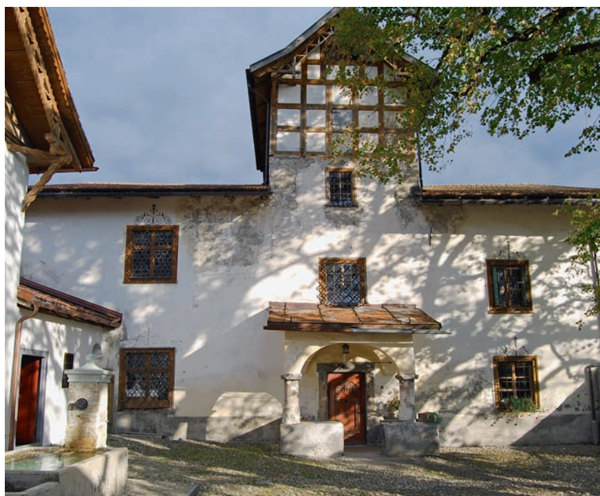
La construction principale et ses annexes ceinturent une cour pittoresque avec sa fontaine.

Le cadre en bois a été restauré par le propriétaire, de ses propres mains, alors que le poêle en forme de tour a été reconstruit selon la forme et les dimensions appropriées. Comme par le passé, le poêle est alimenté depuis le couloir par l'intermédiaire d'une porte antérieure en fer forgé, la porte du foyer proprement dite, dont l'encadrement est en pierres naturelles. Le corps intérieur du poêle est construit suivant les standards les plus récents de la fumisterie. La comparaison entre la technique de combustion ancienne et actuelle ressort clairement des plans qui ont été établis (ill. 2).