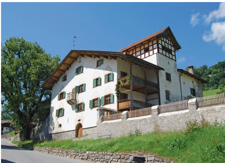
Das Haus am Landsgemeindeplatz wurde um 1680 erbaut und gehört zu den stattlichsten und markantesten der Luzeiner Sprecherhäuser.