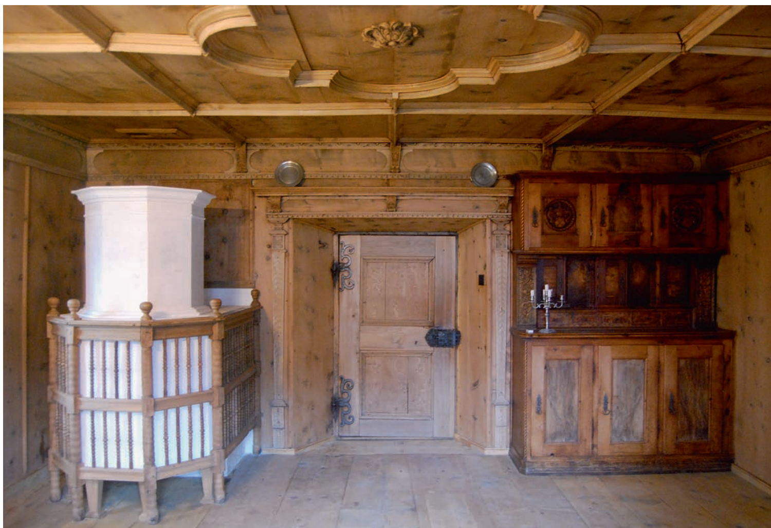
Le poêle à l'achèvement de sa construction. La pièce possède un lambrisage de bois d'arole datant de 1708.